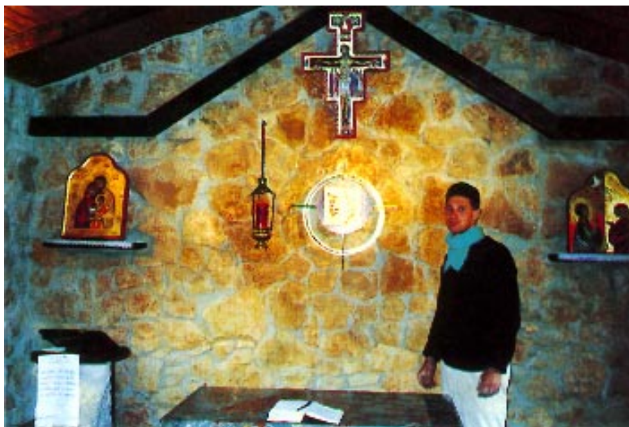
Interior de la Capilla del Cenacolo, la comunidad fundada por Sor Elvira