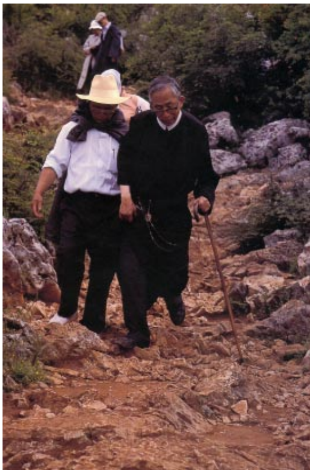
Subiendo el Podbrdo

Medjugorje demuestra ser mucho más que un lugar de peregrinación porque allí la Virgen se aparece. Es, ante todo, la manifestación de la gracia a partir de donde una vida se transforma y no vuelve a ser la de antes. A Medjugorje, si se es mínimamente disponible, se va y no se vuelve igual.